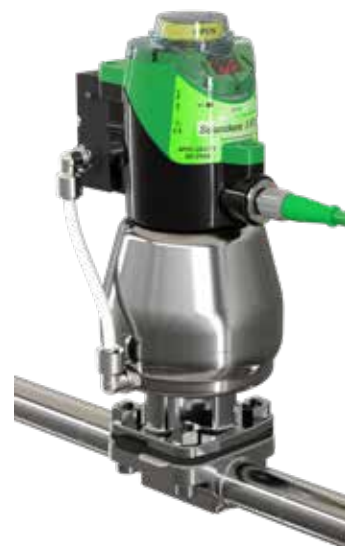
Montage direct du boîtier I-VUE

Rendez-vous sur le site www.saundersS360.com pour de plus amples informations concernant les autres produits Saunders ® , y compris les fiches techniques, la bibliothèque de plans, ainsi que les outils de sélection de produits.