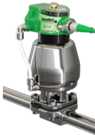
Montage direct du boîtier M-VUE

*Available with Limit Open Stop on request